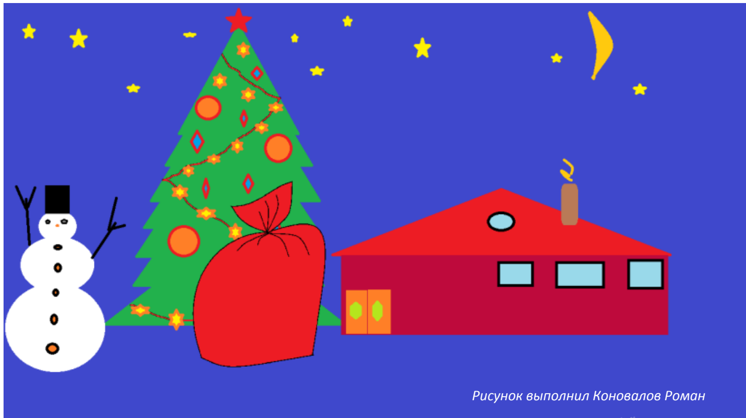
Рисунок выполнил Коновалов Роман

Дорогие ребята, учителя и все великосёлы! Поздравляем вас с Новым годом! Наряжается ёлка, становится краше, В Новый год ей положено быть на виду. От души поздравляем! Пусть желания ваши Обязательно сбудутся в Новом году. Пусть закончатся стройки, найдутся потери,