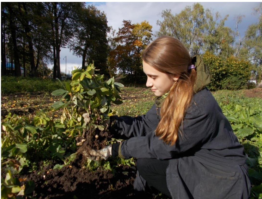
Фото №4 Первый урожай арахиса