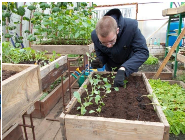
Фото №2 Пикировка рассады