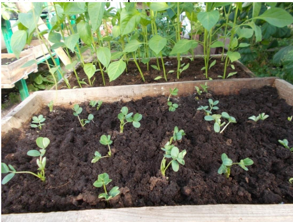
Фото №2 Молодые всходы арахиса