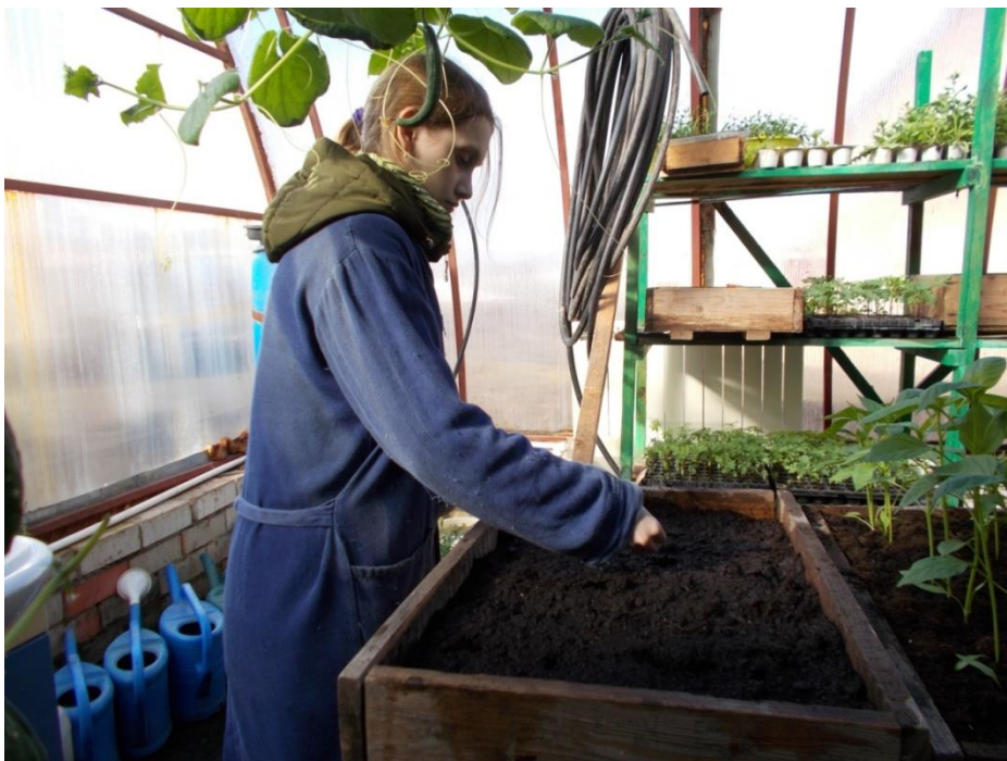
Фото №1 Посев семян арахиса