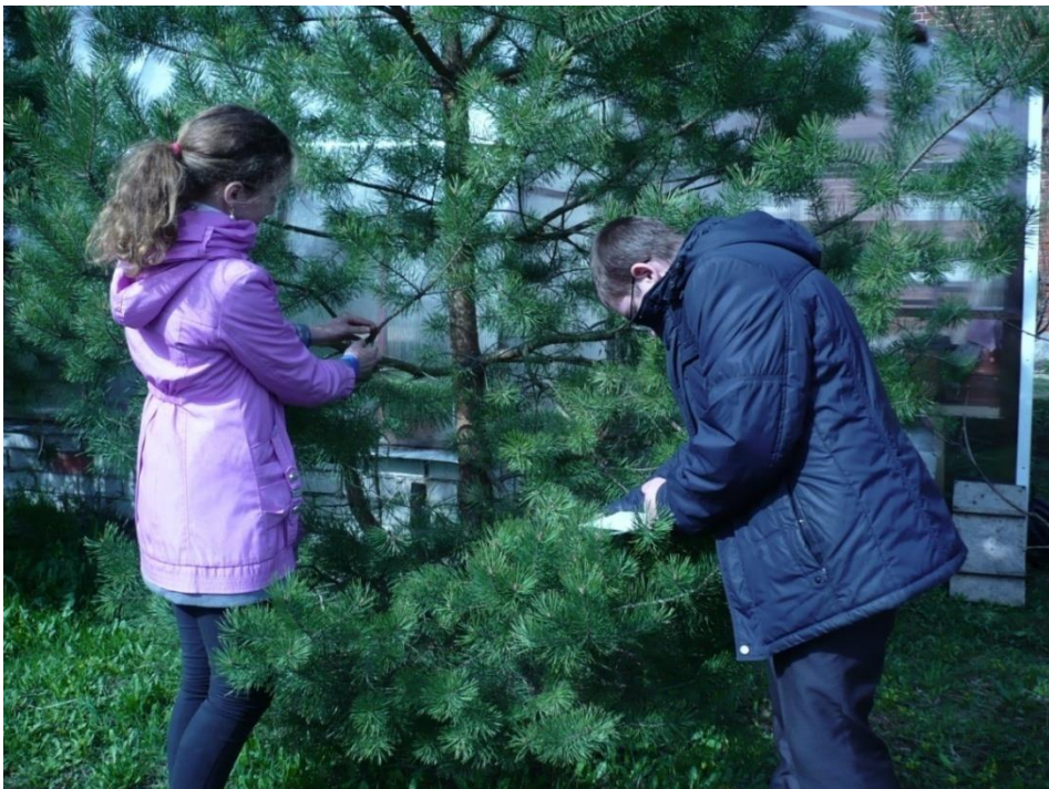
Фото №2 Изучение коры молодой сосны