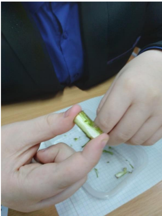
Фото №2 Рассматриваем расположение камбия