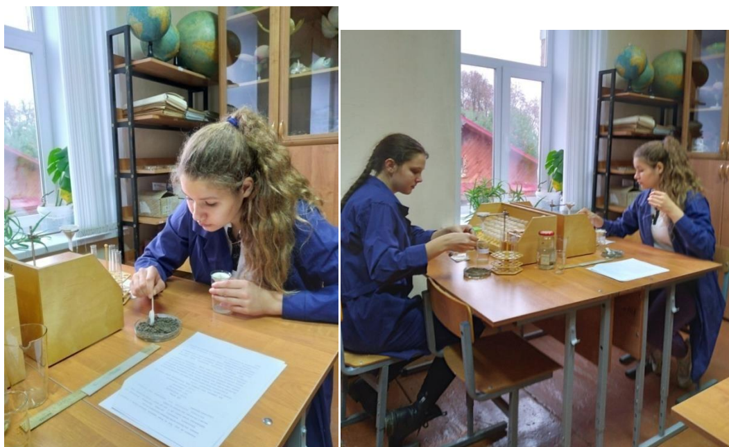
Фото №1. Взяли пробы земли Фото № 2 Получение почвенного раствора на полях УОУ