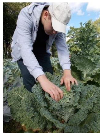
Фото №4 Савойская капуста, сорт «Вертю 1340»