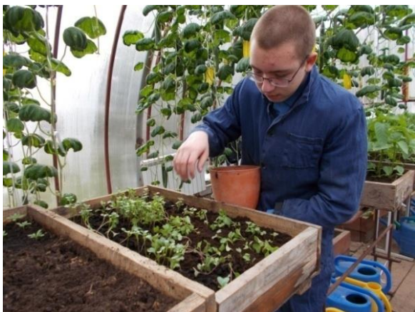
Фото №1 Уход за рассадой капусты

- у савойской капусты листья крупные, сильно курчавые, морщинистые, пузырчатые, имеют зеленую окраску с разными оттенками в зависимости от сорта. Она более морозоустойчива, чем другие виды капусты.