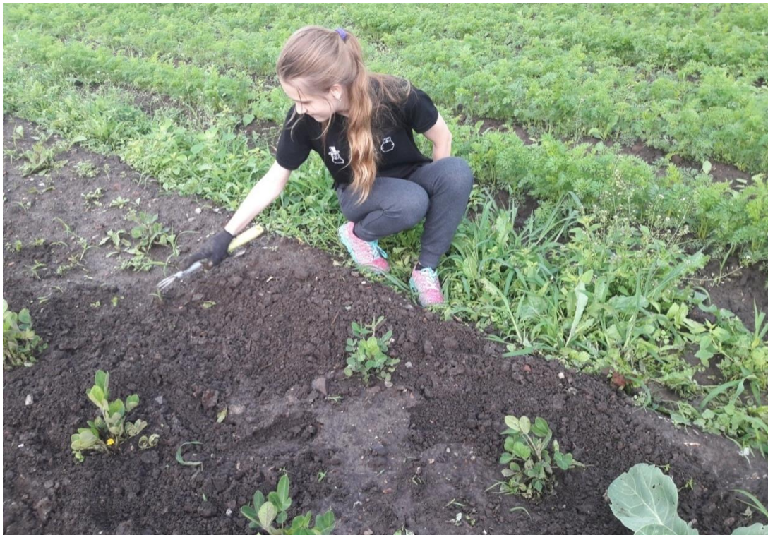
Фото №3 Уход за арахисом в открытом грунте