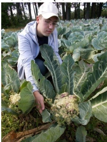
Фото №3 Цветная капуста, сорт «Спаржевая»