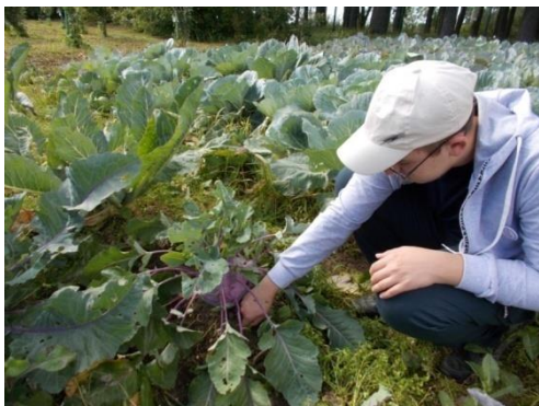
Фото №5 Капуста кольраби, сорт Виолетта»