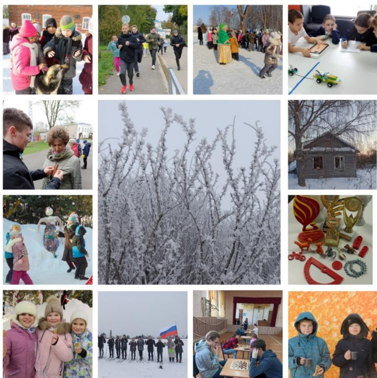
Коллаж создан из конкурсных работ участников в номинации «Фото»

Всех ребят приглашаем участвовать в конкурсах по вашим интересам и хобби!